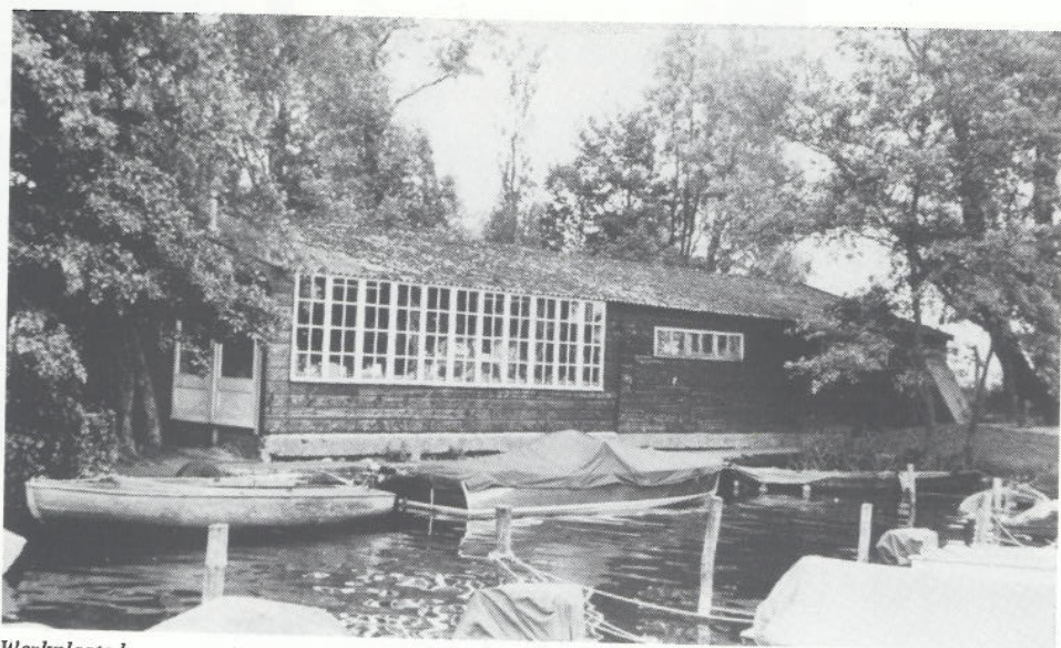
Werkplaats havenmeester en zogenoemde FJ-loodsje; op deze plaats zou de huidige stenen loods komen

de reeds lang bestaande bemanningswedstrijd; het motief voor het instellen van deze laatste wedstrijd was: De bemanningen leven altijd min of meer in de schaduw van hun stuurman en laat ze ook eens trachten in een nationale te schitteren.